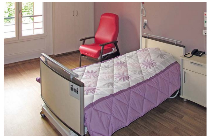
Zimmer im Pflegebereich mit PVC-Bodenbelag über dem SensoFloor

Das Begehen des Bodens erzeugt Sensorsignale, die zu einem Empfänger gefunkt werden. Eine am Boden liegende Person löst Sturzalarm aus.